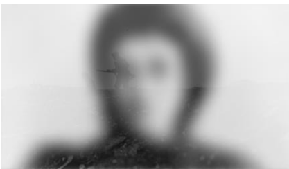
Ghassan Salhab, une rose ouverte / Warda , Video (Still), 72 min, 2019.