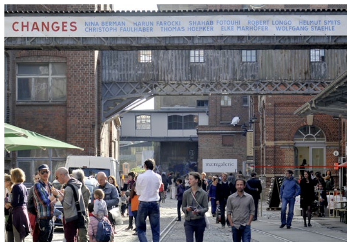
Leipziger Baumwollspinnerei, Tour of the SpinnereiGalleries / Leipziger Baumwollspinnerei, Rundgang der SpinnereiGalerien, Mai 2011

Kontakt: Michael Arzt Tel.: +49 (0)341 492 42 02 Mobil: +49 (0)176 23 23 76 76 E-Mail: arzt@halle14.org Skype: halle_14