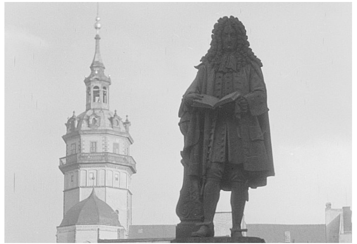
Leibniz memorial with Nikolai church in the background / Leibnizdenkmal, im Hintergrund die Nikolaikirche in Leipzig, 1948.

Die Leipziger Baumwollspinnerei ist ein 12 Hektar großes Fabriken-semble mit 24 denkmalgeschützten Produktionshallen und Gebäuden aus der deutschen Gründerzeit. Von 1884 bis 1907 expandierte sie zur größten Baumwollspinnerei Kontinentaleuropas. Während der Einstellung der Garnproduktion in den 1990er Jahren siedelten sich bereits erste Alternativnutzungen durch Künstler an. Heute finden hier über 100 bildende Künstler, u. a. einige, die die Neue Leipziger Schule prägen, und weitere kreativ Tätige ideale Atelier- und Büroräume für ihre Arbeit. Seit 2002 hat sich die ehemalige Fabrikanlage in eines der dichtesten und lebendigsten Kunst-reale Deutschlands verwandelt. Seit 2004 haben sich hier bereits mehr als zehn Leipziger und internationale Galerien angesiedelt. Außerdem befindet sich auf dem Gelände u.a. ein Theater, ein Kino, ein Künstlerbedarfsmarkt, das Internationale Choreografische Zentrum, mehrere Druckereien und Handwerksbetriebe. Die Baumwollspinnerei zählte zu den Gründen, weshalb die Stadt Leipzig von der New York Times auf Platz 10 der »Places to Go in 2010« und 2011 von The Guardian auf Platz 1 des »Best of Germany« gekührt wurde.