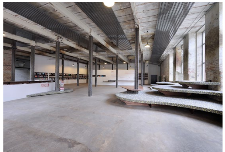
HALLE 14 visitor centre with information desk, visitors' lounge and library / Besucherzentrum der HALLE 14 mit Infotresen, Besucherlounge und Bibliothek, 2010

Das 2002 gegründete, gemeinützige Kunstzentrum HALLE 14 ist Schauplatz, Denkraum und Produktionsort für zeitgenössische Kunst. Das fünfgeschossige Industriedenkmal HALLE 14 mit einer Gesamtfläche von 20.000 m 2 befindet sich auf dem Gelände der Leipziger Baumwollspinnerei. Seit 2003 finden hier jährlich ein bis drei internationale Gruppenausstellungen statt, die gesellschaftskritische Positionen präsentieren (z. B. »Die Kultur der Angst«, 2006 und »Mit krimineller Energie - Kunst und Verbrechen im 21. Jahrhundert«, 2012), Ausstellungstraditionen und Rezeptionsgewohnheiten herausfordern (z. B. »An das Gerät!«, 2010) oder wenig vertretene Kunstregionen in den Fokus rücken (z. B. »Pause the Pulse: Portrait of Accra«, 2010). Auch unsere einzigartige Kunstbibliothek mit einem Bestand von mehr als 36.000 Büchern und Medien, das Kunstvermittlungsprogramm, die Veranstaltungsreihen und unser Studioprogramm machen die HALLE 14 zu einem lebendigen und vielfältigen Ort der Kunst mit überregionaler und internationaler Anerkennung.