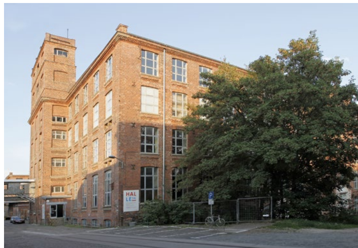
HALLE 14, 2011

Founded in 2002, the non-profit art centre HALLE 14 is a space for the presentation of, reflection on and communication about contemporary art. HALLE 14 is a lively, nationally and internationally recognized art centre with multiple facets. International group exhibitions such as "The Culture of Fear" (2006), "An das Gerät!" (2010) and "With Criminal Energy - Art and Crime in the 21st Century" (2012) connect relevant social issues with artistic and aesthetic questions. Our unique art library, with a collection of more than 36,000 books and other media, is open for public use. We also offer Kreative Spinner, an art education program, series of events and a studio programme. Additional exhibitions are presented by HALLE 14's partner organisations. The five-story, 20,000 m 2 industrial building that houses HALLE 14 is located in the Leipziger Baumwollspinnerei.