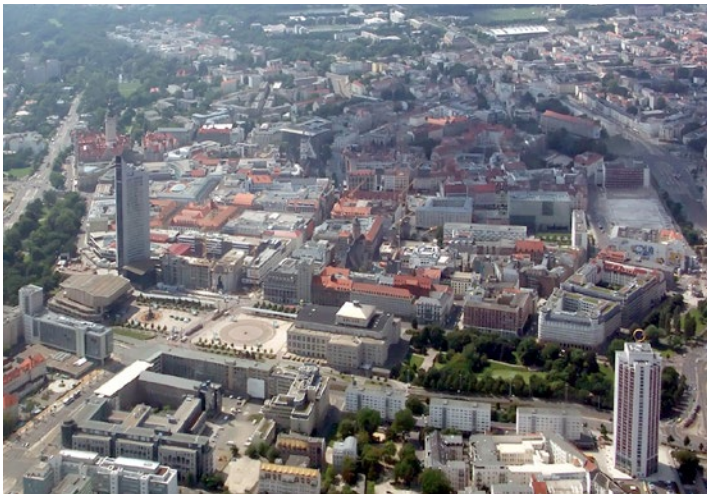
Leipzig, the city centre seen from the east / Leipzig, die Innenstadt von Osten gesehen, 2008.

The Leipziger Baumwollspinnerei is a 30 acre factory complex with 24 historically registered production halls and other buildings built in the late 19th century. From 1884 until 1907, it grew to become the largest cotton spinning mill in continental Europe. In the 1990s, even before yarn production had completely ceased, artists had already begun to put the space to alternative use. Today over 100 creative workers and visual artists, including some who shaped the New Leipzig School, find the ideal studio and office spaces for their work. Since 2002, the former manufacturing plant has transformed into one of the strongest and liveliest centres for art in Germany. Since 2004, over a dozen galleries from Leipzig and around the world have found their home here. The complex also houses a theatre, a movie theatre, an art supply store, the International Choreography Centre, and numerous printers and trades- and craftsmen. When the city of Leipzig was picked as number 10 on the New York Times list of "Places to Go in 2010" and as number 1 of the "Best of Germany" by the Guardian in 2011, the Baumwollspinnerei was always prominently mentioned.