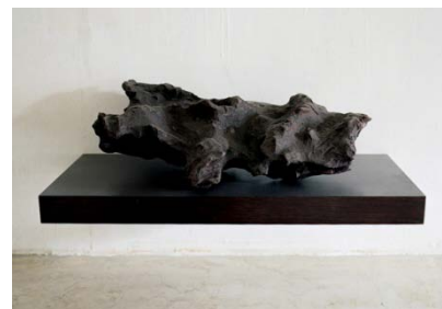
Mahony , Das älteste Stück Ding der Welt, 2007